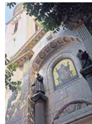
Fassade der Kirche in Kairo

Inzwischen ist die Orgel bis auf ihr Holzskelett auseinandergelassen. In den nächsten beiden Wochen wird Walcker jedes Originalbauteil vermessen und katalogisieren, um dann fehlende Teile in der heimischen Werkstatt nachbauen zu lassen. Von Oktober an will er dann mit seinem Sohn und einem weiteren Mitarbeiter das Instru-